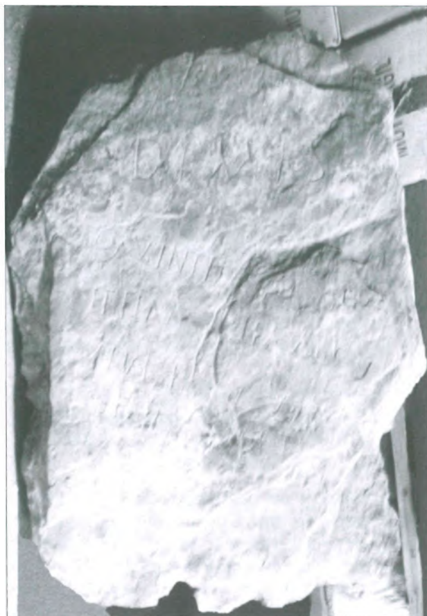
Lámina IV: Epitafio de Quintiliano y Flaminila

una sistematización, desarrollada a partir de las combinaciones de fórmulas epigráficas y decoración, junto a otras variables (NAVASCUÉS, 1970: 191-192; GONZÁLEZ y SANTOS, 1984: 86) y su datación queda establecida desde el siglo II a mediados del s. IV d.C., concentrándose el mayor número en el s. III. Por nuestra parte, los elementos que permiten aproximar la cronología de la inscripción caucense revelan unas fechas del siglo III d.C.