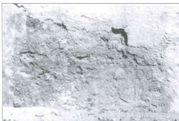
Lámina VII: Fragmento de inscripción inédita hallada en el paramento externo de la muralla de Coca

calizo en su constante exposición a los agentes atmosféricos. Por esta razón, la mayor parte de su superficie se encuentra muy erosionada, permitiendo exclusivamente contemplar con mayor claridad el sector izquierdo del soporte, lugar donde se conserva la parte del campo epigráfico legible.