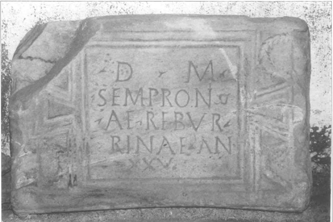
Lámina III: Epitafio de Sempronia Reburrina

vinculadas a esta cultura; adquiriendo un significado relacionado con particularidades físicas asociadas al cabello; interpretado, según el latín tardío, como 'rebelde, de cabello rizado' 32 .