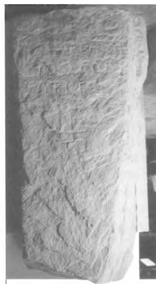
Lámina II: Epitafio de Acces