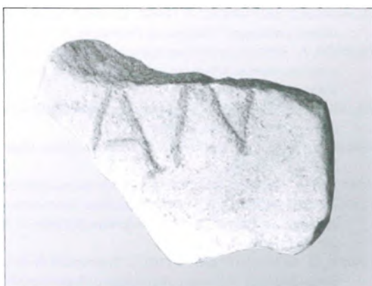
Lámina VI: Fragmento de inscripción procedente del yacimiento de Carralavega (Coca)